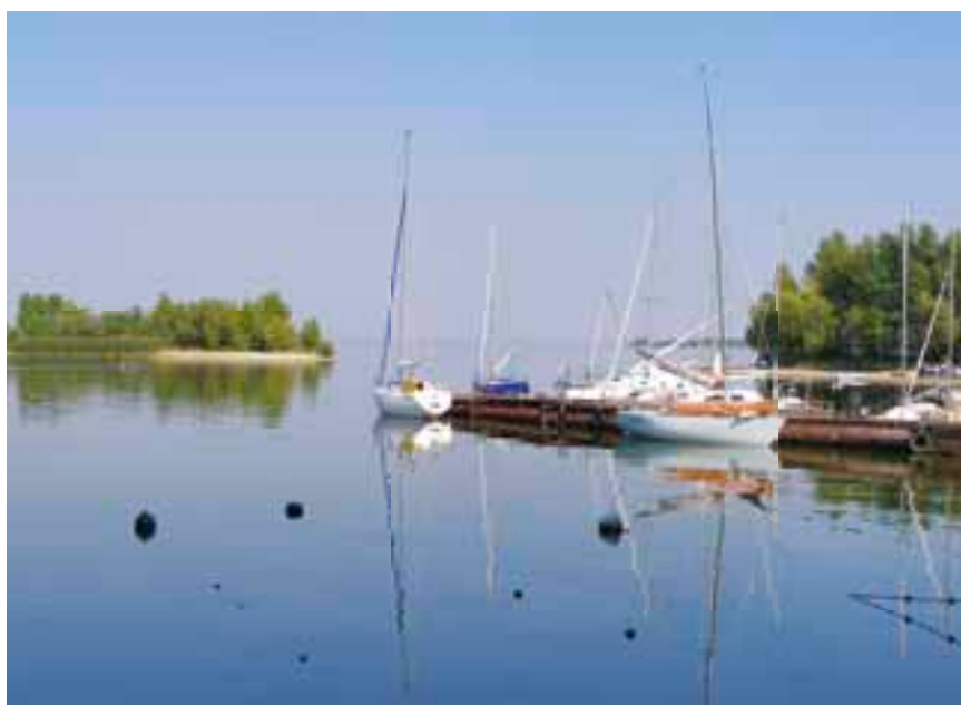
Гостевой понтон яхт-клуба.

Но возвратимся в Кременчугское море. Пройдя под пролётами Черкасского моста, выходим в разлив моря. В двух километрах ниже моста справа открываются Черкасы — живописный и зелёный приднепровский город. В Черкассах есть довольно большой индустриальный порт — он находится ниже по течению. Но для маломерных