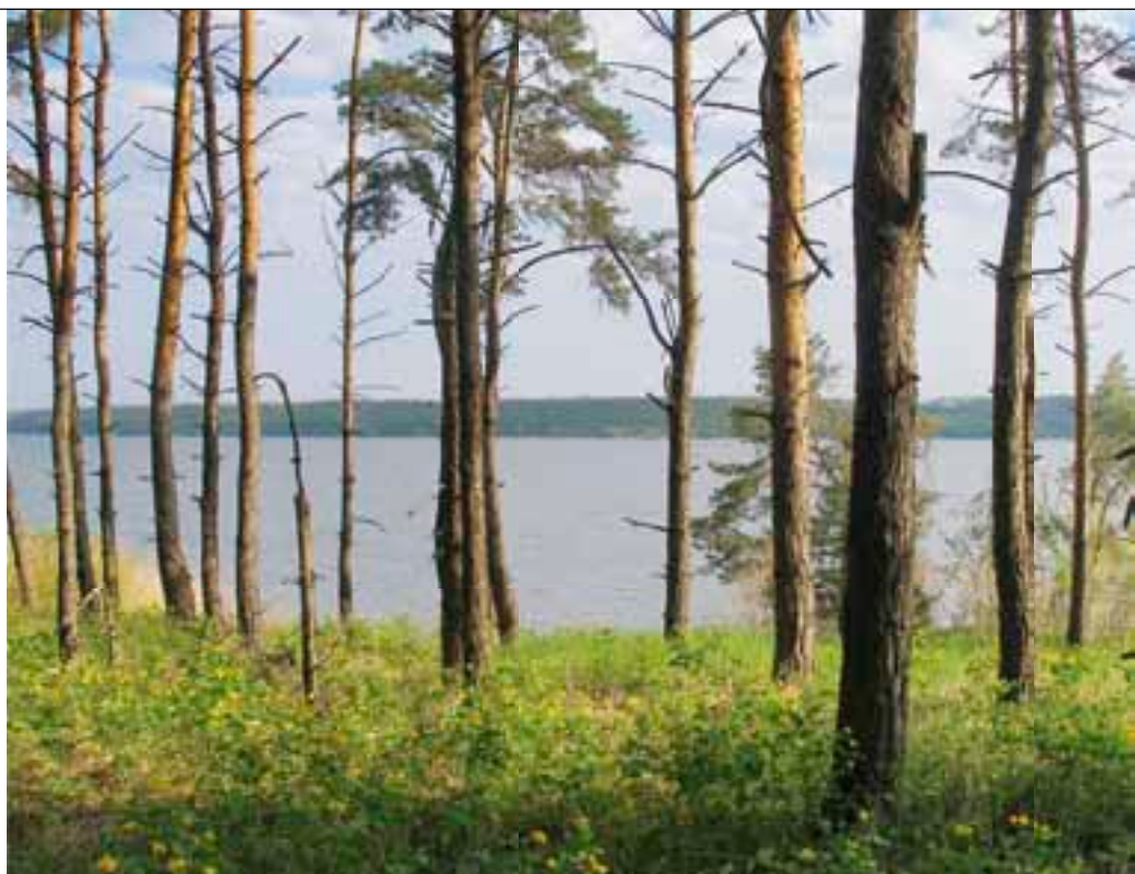
Лес на Жовнино.

Но мы движемся дальше, и впереди по курсу показывается первый из двух наиболее значительных островов Кременчугского моря — остров Веремеевский, расположенный в 6 км от двух безымянных островков и в полутора километрах от левого коренного берега. Глубины на подходах к Веремеевскому непостоянны, чистые глубокие участки воды перемежаются мелководными банками, заросшими водорослями. Поэтому продвижение к острову требует внимательности и постоянных лавировок между полями травы. Здесь также нередки промысловые рыбачьи сети, и чем ближе мы подходим к островам Веремеевский и Жовнино, тем их больше. Поравнявшись с Веремеевским, видим знаменитый остров Жовнино. Оба острова лежат в двух километрах друг от друга, и вытянулись вдоль левого берега почти на 15 км! Острова и коренной берег разделяет