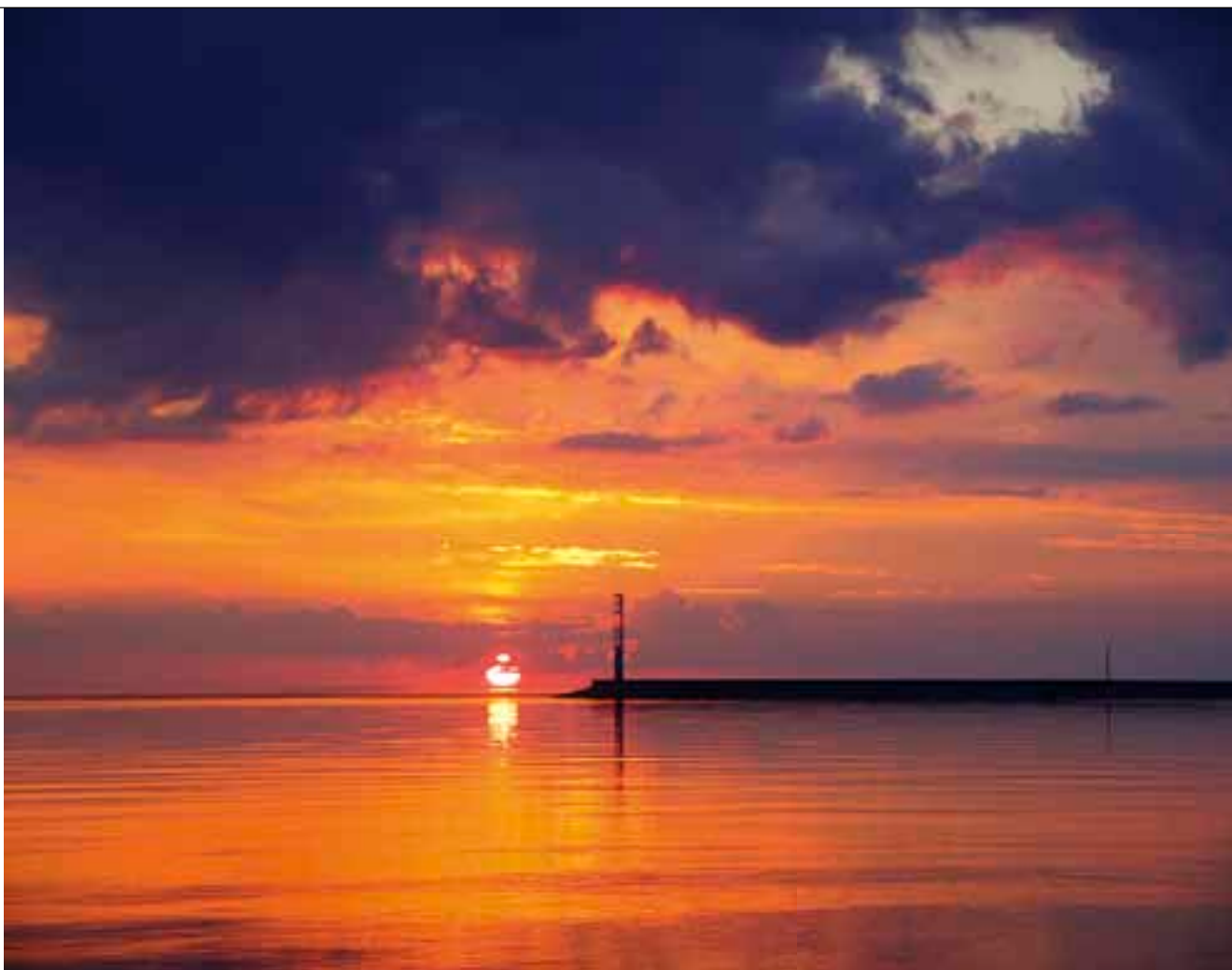
Вид на водохранилище из аванпорта Кременчугской ГЭС.

■ с печенегами, половцами и хозарами. Об этих событиях напоминают многочисленные курганы на распаханых полях. Дорога от воды в село Жовнино занимает полчаса пешком и ведёт через живописные овраги и леса, постепенно поднимаясь выше на гору. Село довольно большое, есть несколько продовольственных магазинов.