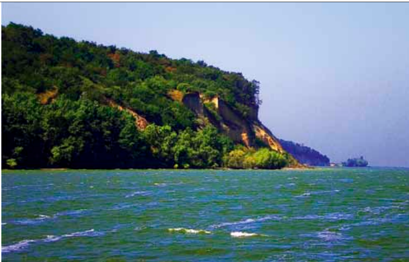
Московская гора — вид со стороны Светловодска.

◀ рыбаки разбивают свои стационарные базы. На острове живут бобры, лисицы, кабаны, лоси. Однажды мы наблюдали, как молодой лосёнок вплавь перебирался с острова на коренной берег. Стараясь не напугать отважного малыша, мы проследили, как он переплыл пролив, выбрался на берег и ускакал в лес.