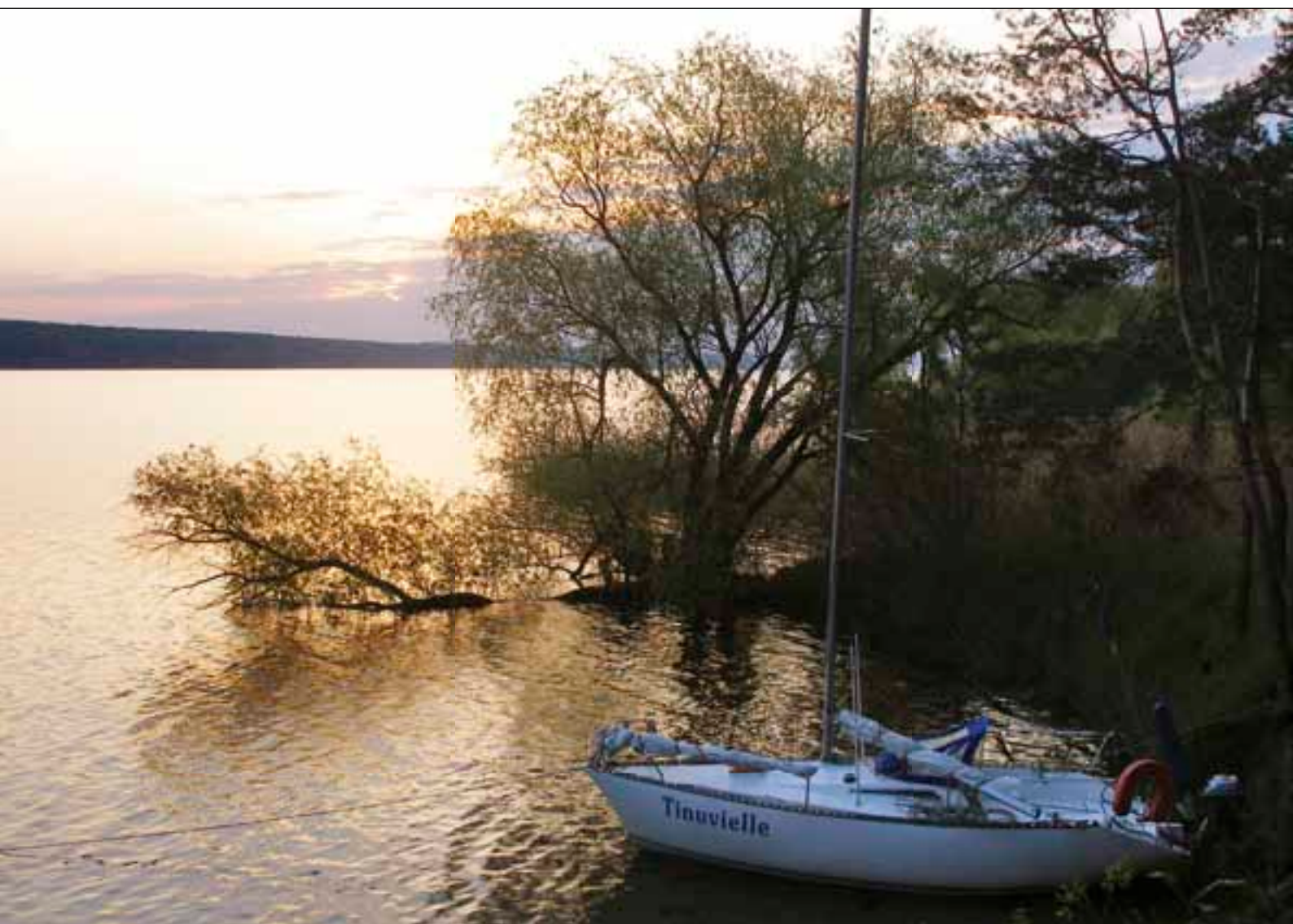
Стоянка на о.Жовнино.

■ расположенные между сёлами Васютинцы и Веремеевка. Однажды, стоя на якорю у одного из островков, я наблюдал игры нерестящейся крупной рыбы — вода буквально «кипела» у самого берега. Также эти островки облюбовали бакланы. Из-за их едких экскрементов деревья вокруг лишились листьев и стали известково-белыми, придавая островку довольно зловещий вид.