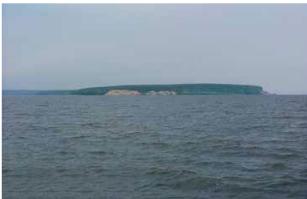
Остров Жовнино — вид с юго-востока.

Как раз в этих местах несколько лет назад я увидел невероятное природное явление — водяной смерч. Мы двигались вдоль левого берега, как вдруг посреди Кременчугского моря, за много километров южнее от нас, облако начало вытягиваться трубкой вниз. Одновременно с этим дымка у поверхности воды потянулась вверх и через какое-то время обе