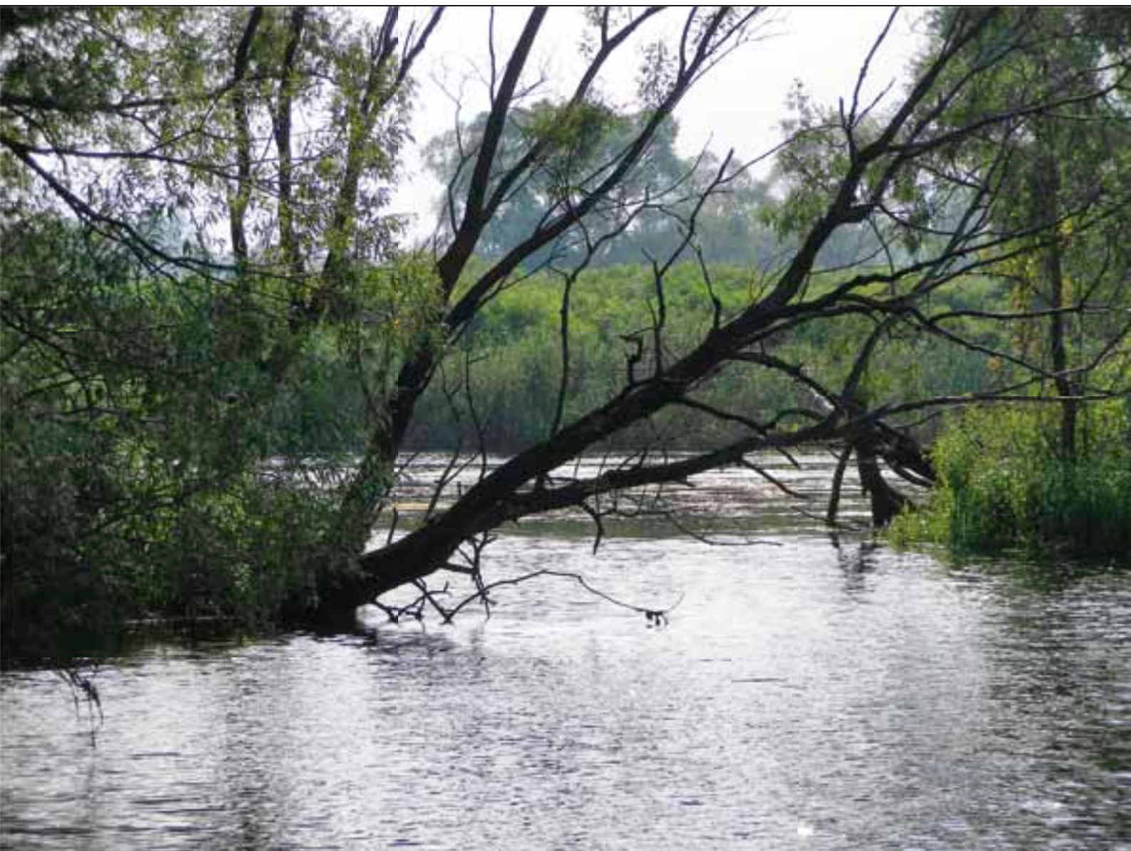
Протоки о-ва Веремеевский.

этому каналу, будьте готовы, что к вам подъедет на моторной лодке с бесшумным электродвигателем местный рыбинспектор, чтобы поинтересоваться, зачем вы пожаловали в их края. Ирклиевский канал оканчивается тихим озером, диаметром метров 400, на берегу которого когда-то был причал, но сейчас от него ничего не осталось. Сам городок расположен в стороне от воды, и поэтому идти в магазин за продуктами или водой придётся пешком не менее часа в одну сторону. Здесь также есть АЗС, где можно заправить канистры топливом.