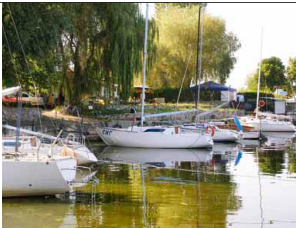
Яхт-клуб «Парус» г.Черкасы.

Подойдя сверху по течению к Черкасскому мосту, следует соблюдать осторожность: высота судоходного пролёта при высоком уровне воды может составлять не более 13 м, при этом на подходах к мосту увеличивается свальное течение, которое быстро несёт яхту к пролётам моста. Поэтому, если вы не уверены, проходите ли мост по высоте своей мачты, следует подходить к пролёту на самом малом ходу, по диагонали и с включенным двигателем. В прошлом году я на своём «Атлантике» (Bavaria 30 Cruiser) с высотой мачты 14,1 м не смог пройти под Черкасским мостом. Яхту нужно было где-то оставить на несколько дней. Пришлось повернуть обратно и пойти в яхт-клуб гостиничного комплекса «Селена» (20 км вверх по течению от Черкасс, в селе Свидовок). Заход с фарватера в протоку правого берега, ведущую в «Селену», находится возле красного буя №72, координаты места N 49°30'18"; E 31°59'45". В маленькой бухте стоит несколько приличных бонов с ошвартованными катерами. Место премиумное. Стоянка, пожалуй, дороговата: 200 грн. в сутки.