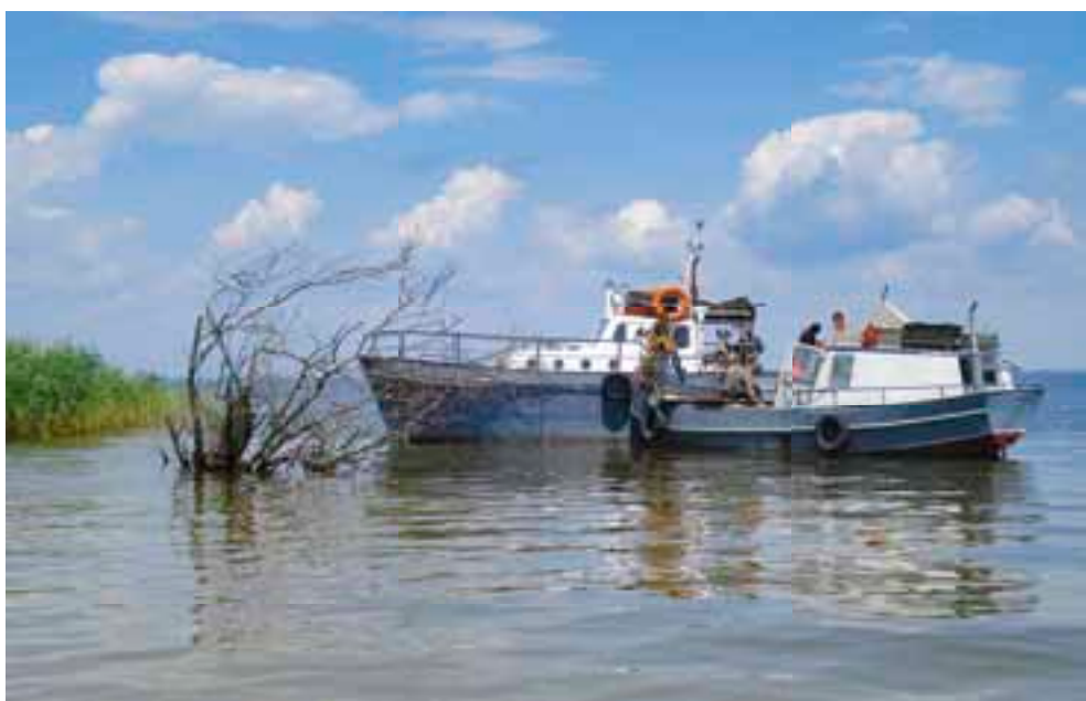
Рыбачьи сейнеры (ладуги).

наконец расширяется и выходит во внутреннее озеро. К сожалению, яхтам с осадкой больше 1,5 м не войти в «Сказку». А при низкой воде яхтам и с меньшей осадкой вход в бухту может быть закрыт. Но это место определённо стоит того, чтобы туда попасть.