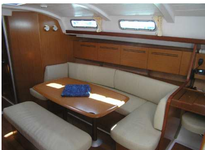
Это кают-компания. Справа – часть штурманского стола