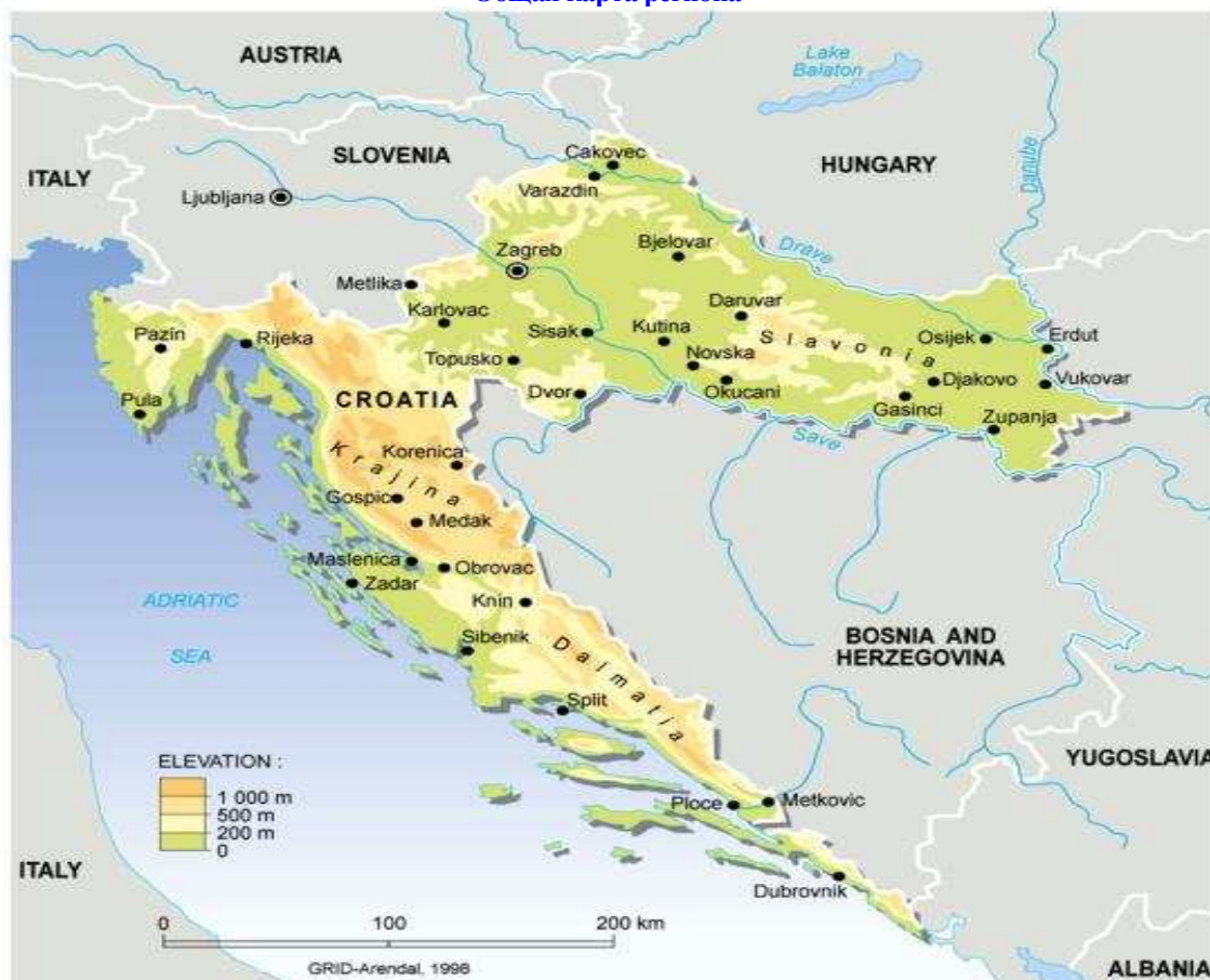
Общая карта региона

К нашим услугам яхт клуб партнера H 2 O, чартерного оператора Sunsail, в небольшом живописном городке Кремик, район плавания здесь характерен мягким средиземноморским климатом, красивыми пейзажами и вкусной местной кухней.