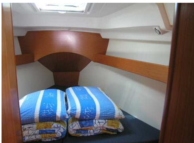
Носовая двухместная каюта Над головой расположен большой открывающийся люк. В каюте есть два шкафа для вещей.