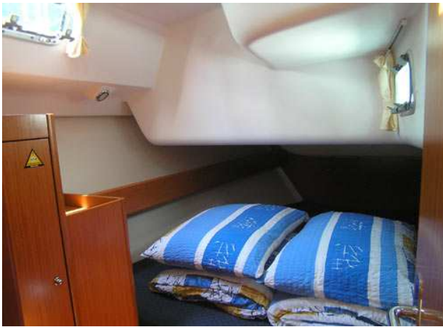
Кормовая двухместная каюта