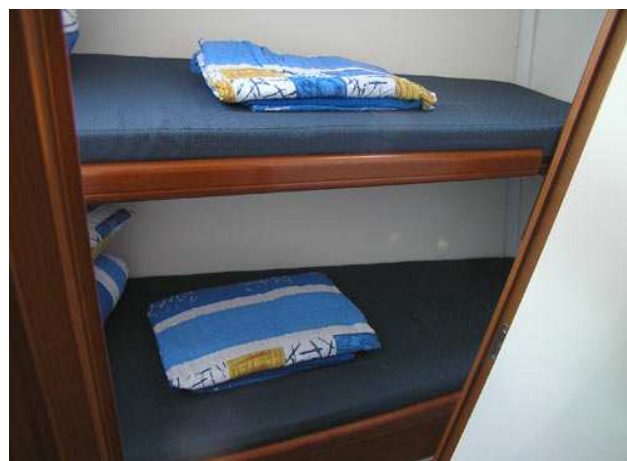
2-я носовая двухместная каюта