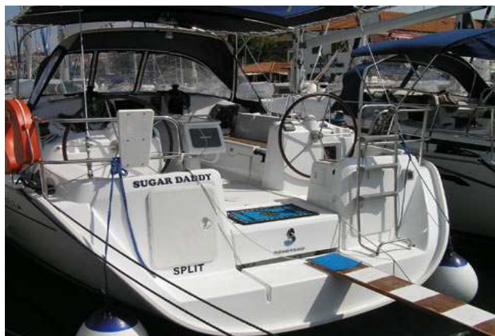
Это вид на яхту с кормы. Эта часть яхты называется кокпит.

Как видно, на наших яхтах двойные штурвалы. Это сделано для удобства управления штурвалом при крене. На специальный пьедестал перед штурвалом выведены навигационные приборы: компас, карт-плоттер, лаг и лот. Лот измеряет глубину, лаг – скорость и пройденное расстояние, а карт-плоттер – это GPS маршрутизатор. Также на яхтах есть автопилот. Яхты укомплектованы солнцезащитным съемным тентом – бимини, расположенным над кокпитом.