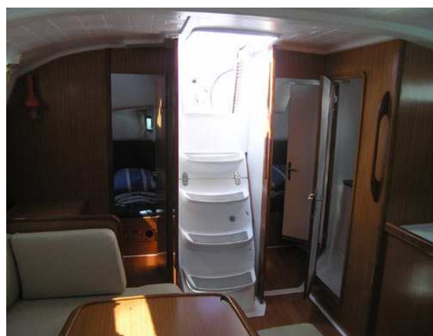
Вход в каюту По обе стороны от трапа – кормовые каюты. Еще правее – вход в галюн (туалет с душем)