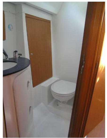
Гальюн (туалет с душем)

Горячая и холодная вода, открывающийся иллюминатор, шкафчик для туалетных принадлежностей, септик – бак (используется при стоянке в порту)